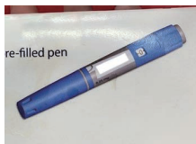
偽造医薬品見本(瘦身薬)