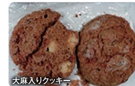
大麻入りクッキー

海外旅行のお土産として買ったり、もらったりしたクッキーやチョコレート等の中に大麻が含まれているものもあります。また、電子タバコの中に液体状の大麻を入れて密輸する例も相次いでいます。これらは全て「大麻」であり、日本に持ち込むこと、人にあげること、持っていることは違法です。「これぐらいなら…」ではすまされない「犯罪」になるので、十分に注意してください。